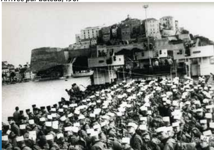
Arrivée par bateau, 1967